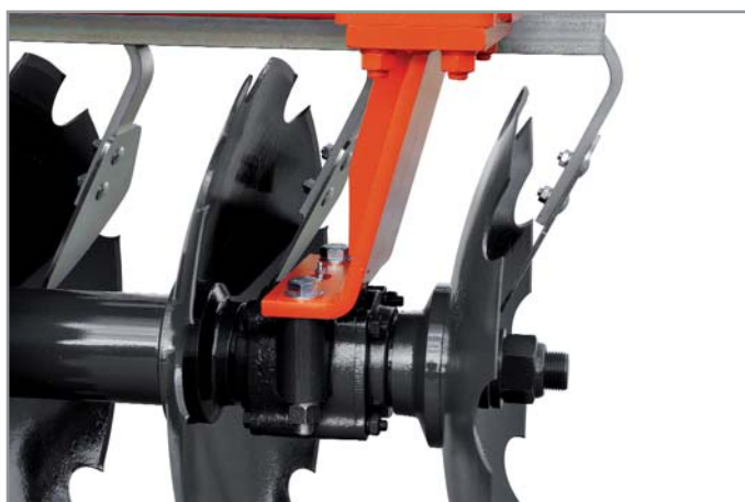
PARTICOLARE SUPPORTO PESANTE CUSCINETTO A RULLI PARTICULAR HEAVY SUPPORTS ROLLER BEARINGS